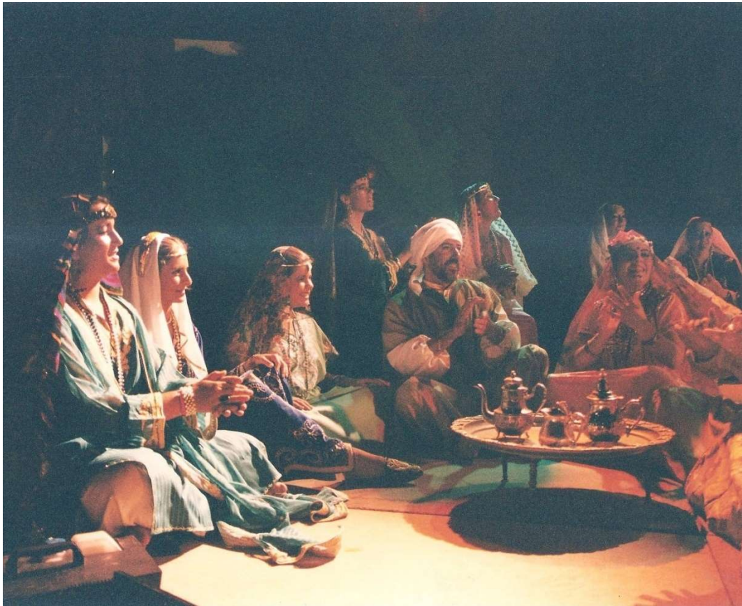
Pronto empezará la fiesta que anunció la madrugada