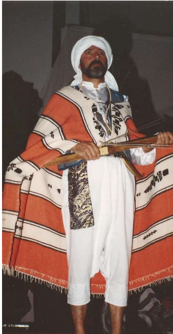
Levantaos y mirad a los cielos