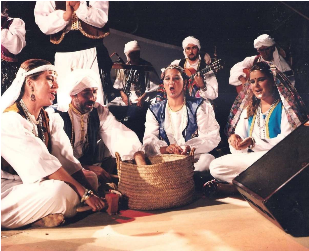
Sobre la arena “mojá” se fundieron aquellos cuerpos al llegar la “madruga”