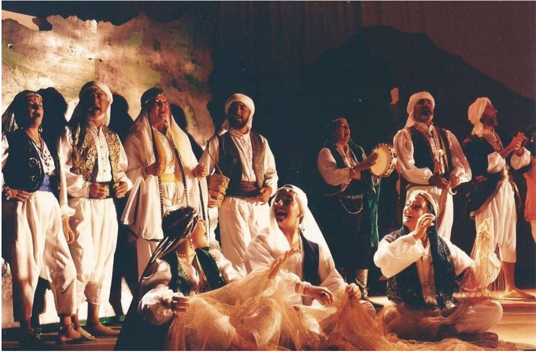
Vuelos de águilas reales impulsaron sus hazañas