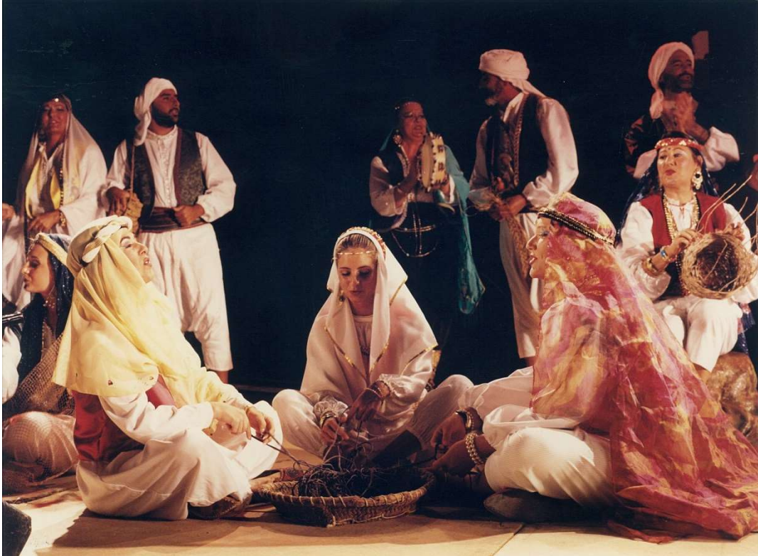
Alegría en Benestepar, pronto el Jehri llegará.