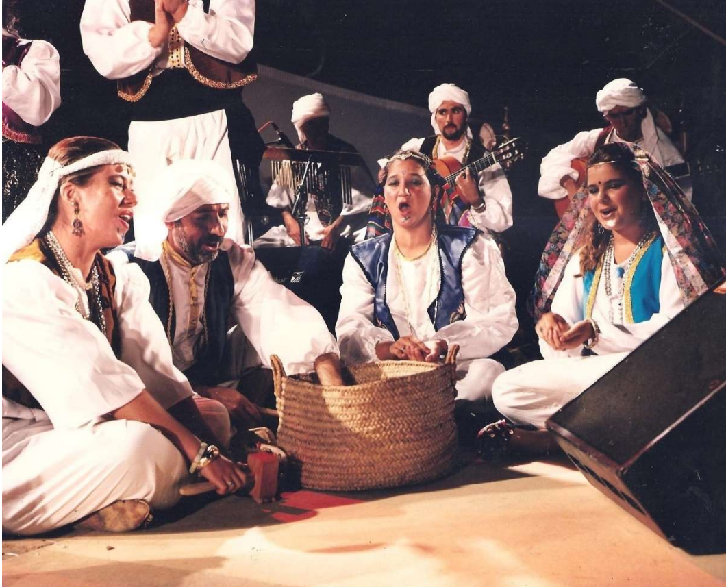
El mirlo se alegra porque aquí tú estas