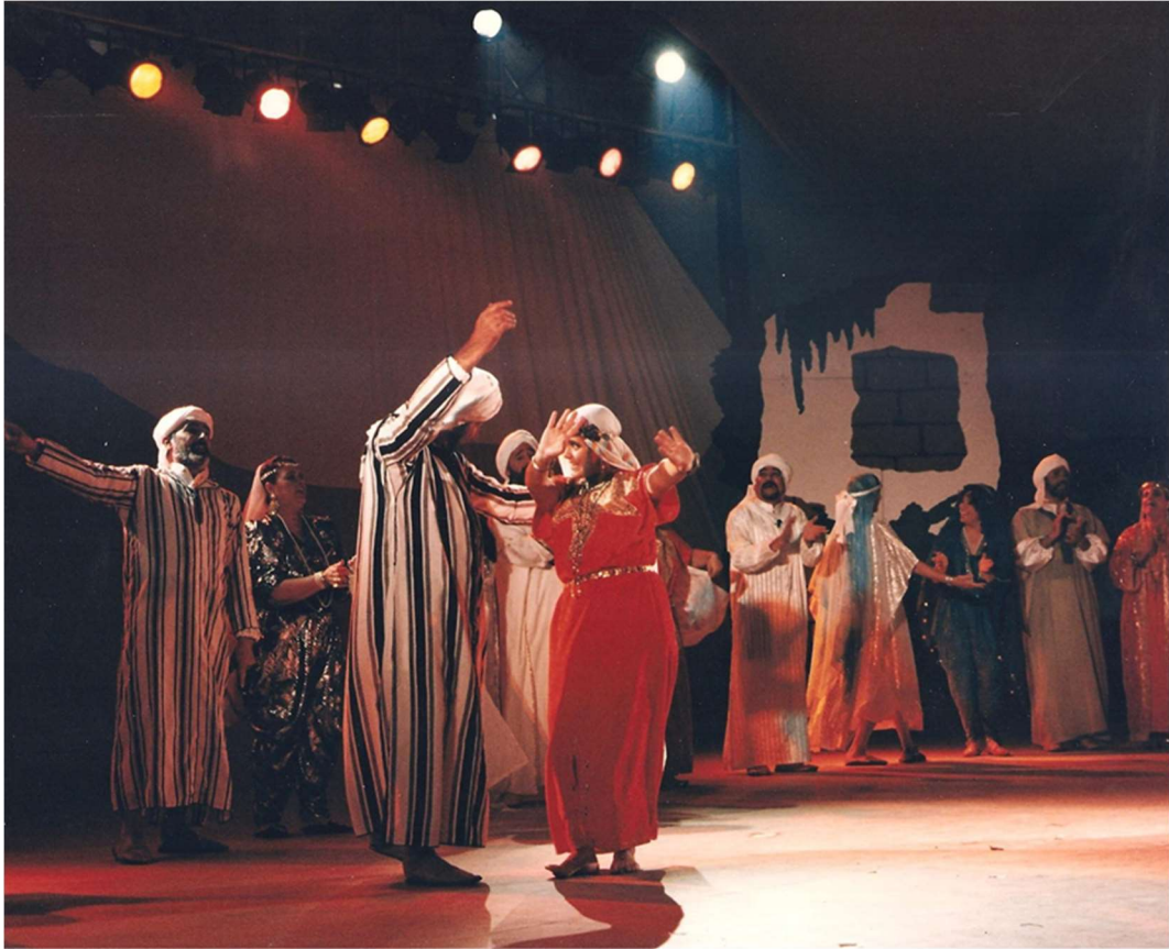
Hoy es día grande en Xeb-Alhamar